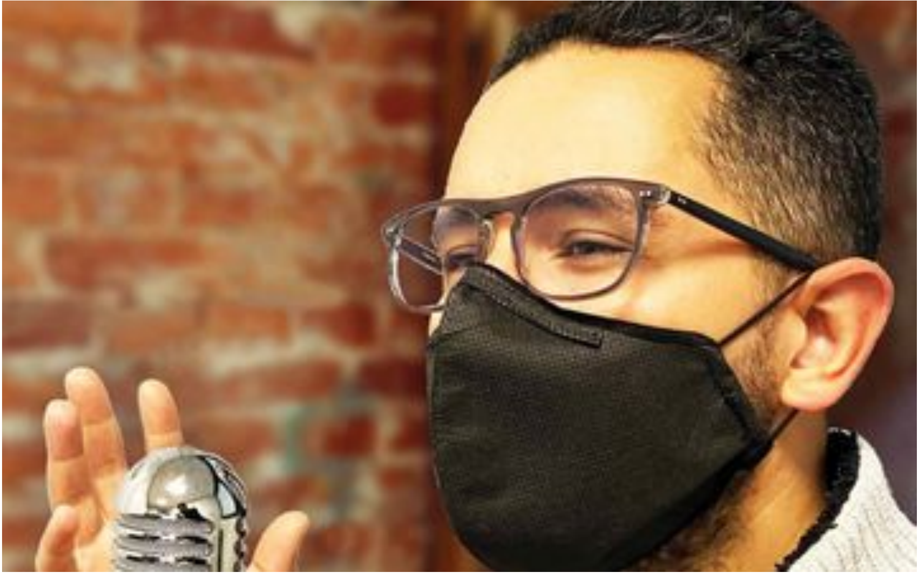
Coronavirus : les choristes ont leur masque !